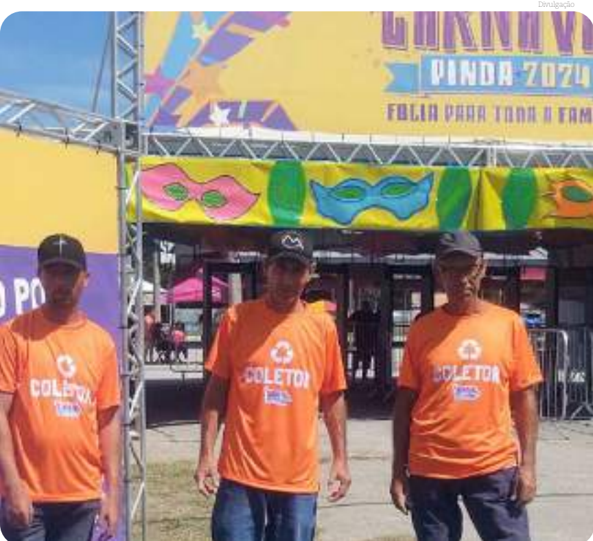
Profissionais da reciclagem

Os critérios para elaboração da Lei de Diretrizes Orçamentárias deverão ser, necessariamente, os contidos na Constituição Federal, na Lei de Responsabilidade Fiscal e na Lei Orgânica do Município.