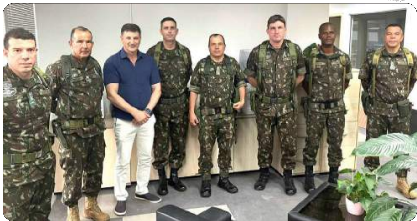
A participação do Exército será uma grande ajuda no combate a dengue