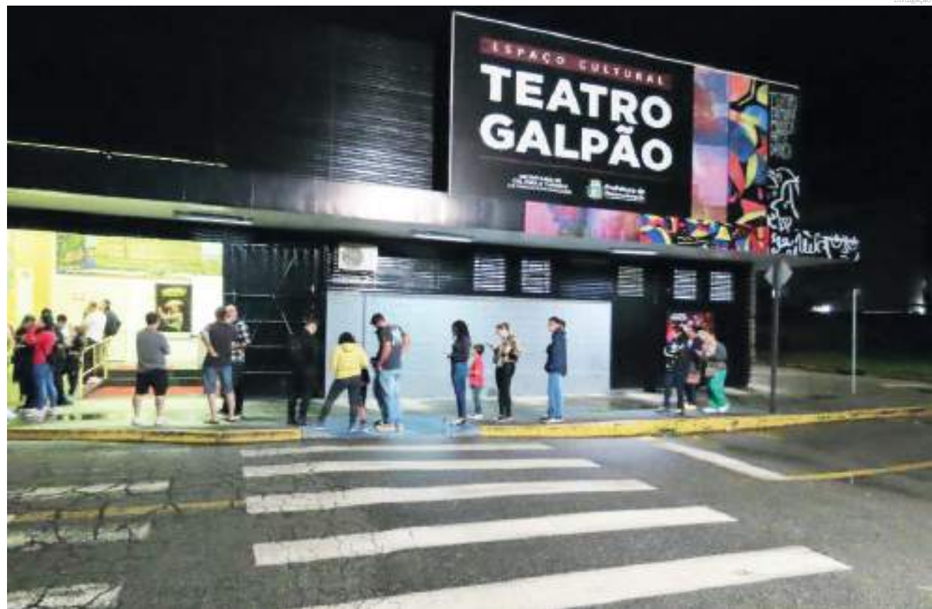
A premiação apoiará o trabalho realizado pelos agentes culturais de Pindamonhangaba